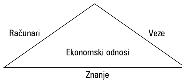
Shema 1: Elementi Nove ekonomije